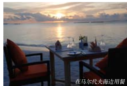
在马尔代夫海边用餐