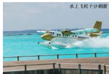
水上飞机十分刺激